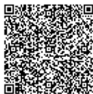
คู่มือการใช้งาน Pre-Register