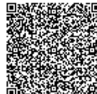
คู่มือการใช้งาน E-Voting